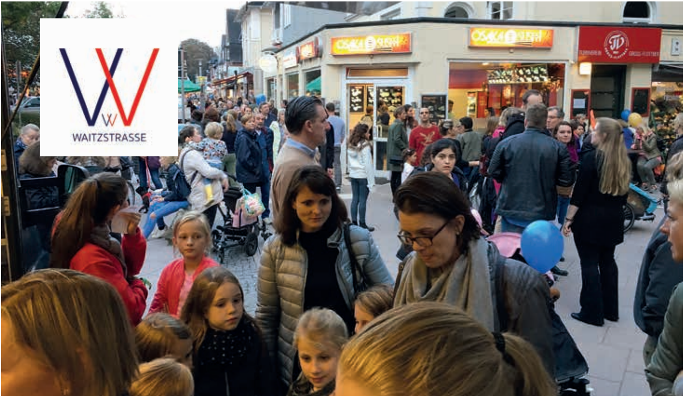
Viele Menschen drängen sich beim Lichterfest 2019 in der Waitzstraße.