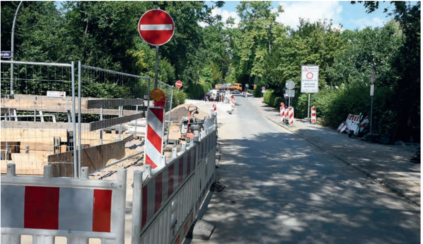
Strassensperrung für den Bau der Fernwärmeleitung in der Parkstraße