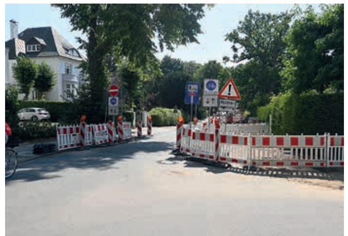
Die Sperrung in der Parkstraße soll noch bis zum 31.12.2022 andauern.

Wenn Zusagen gemacht werden, müssen der Senat und Ihr Staatsunternehmen sich daran halten.