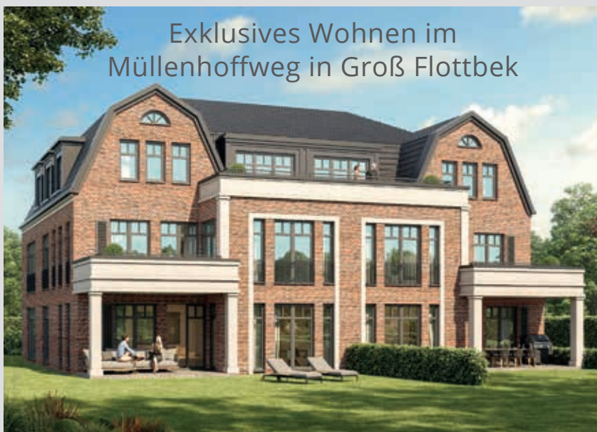
Exklusives Wohnen im Müllenhoffweg in Groß Flottbek

Was folgt nun? Der BVFO wird sehr gerne begeisterte Künstler auf dem Weg der Verschönerung unterstützen. Wir werden auch mit den Schulen sprechen, um zu sehen ob wir Unterstützung finden. Wir bleiben an der Sache dran, auch mit den in der Bezirksversammlung vertretenen Parteien und dem Bezirksamt. Unser Othmarschen, unser Flottbek haben es verdient.